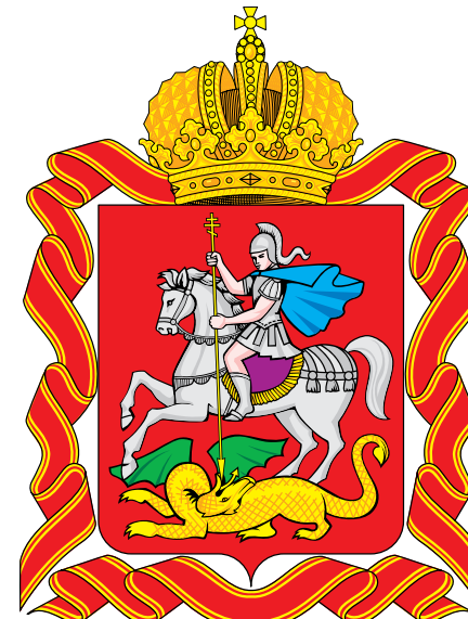
Лауреат Субъект Российской Федерации Московская область