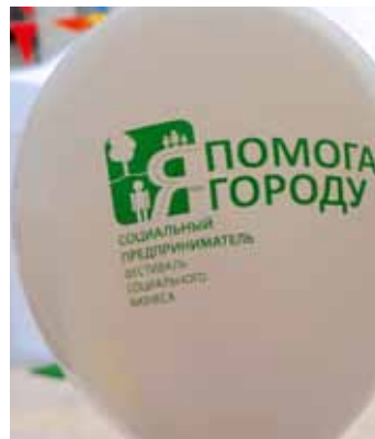
Первый городской Фестиваль социальных предпринимателей «Я помогаю городу»