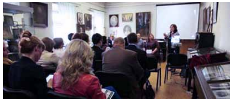
Совместное заседание Комитета РСПП по корпоративной социальной ответственности и демографической политике и Комитета «ОПОРЫ РОССИИ» по социальному предпринимательству и корпоративной социальной ответственности