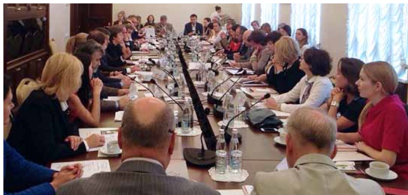
Собрание «Интеллект-центра» программы «Ресурсный банк развития социального предпринимательства»