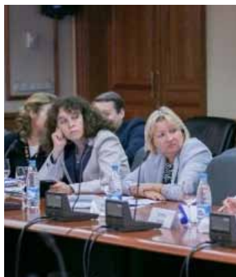
Круглый стол на тему: «Рынок социального инвестирования: международный и российский опыт»