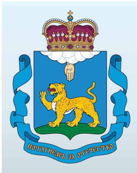
Лауреат Субъект Российской Федерации — Псковская область

В 2018 году при поддержке Центра инноваций социальной сферы создано 6 предприятий в социальной сфере, реализовано 19 проектов, создано 32 рабочих места.