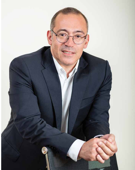
Лауреат Константин Александрович Лившиц