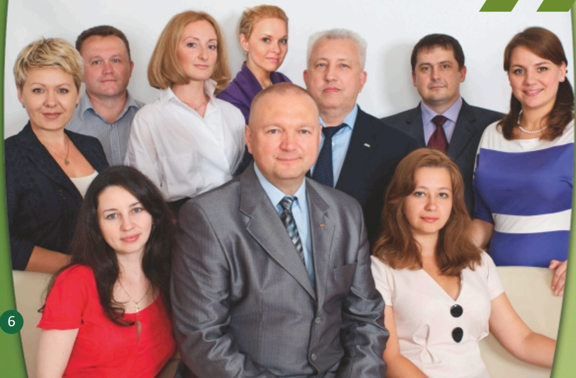
Команда Фонда «Наше будущее»